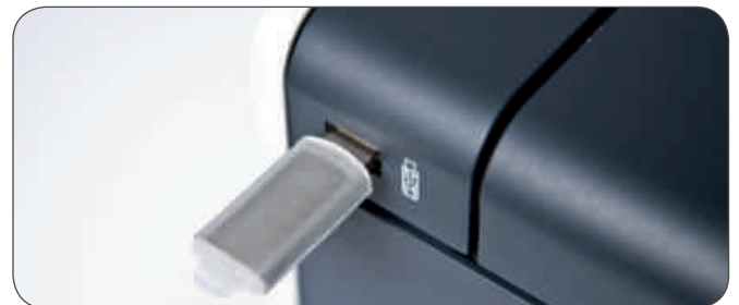
Direktes Drucken vom USB-Stick

Mit nur 0,9 Watt im Tiefschlafmodus verbraucht der HL-4570CDW/CDWT äußerst wenig Energie. Die optionale Toner-Großkartusche (Super-Jumbo-Toner) hilft beim Materialsparen: So drucken Sie bis zu 6.000 Seiten, bevor Sie wieder eine neue Kartusche einlegen müssen, und reduzieren die Unterhaltungskosten damit erheblich.