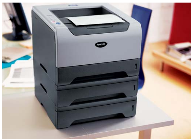
Brother HL-5240 mit zwei optionalen Papierkassetten LT-5300

Drucken Sie oft mehrseitige Dokumente mit der ersten Seite auf Geschäftspapier? Oder verwenden Sie verschiedene Papiergrößen? Der Brother HL-5240 ist standardmäßig mit einer 250 Blatt Papierkassette sowie einer 50-Blatt-Multifunktionszufuhr für Medien bis zu 161 g/m 2 ausgestattet. Im Druckertreiber können Sie den Zuführungen die einzelnen Papiergrößen zuweisen und die Kassetten gezielt ansteuern. Das erspart Ihnen nervigen Papierwechsel. Sollten 300 Blatt Papierkapazität nicht ausreichen? Dann rüsten Sie einfach auf. Bis zu zwei weitere Kassetten für jeweils 250 Blatt werden unterstützt. Mit bis zu 800 Blatt sind Sie für alle Fälle gut gerüstet.