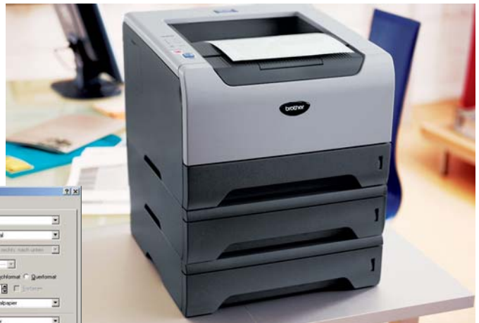
Brother HL-5250DN mit zwei optionalen Papierkassetten LT-5300

Bei Teamdruckern spielt neben der Performance auch das Papier-Management eine wesentliche Rolle. Der HL-5250DN verfügt über eine 250 Blatt Papierkassette sowie eine 50-Blatt-Multifunktionszufuhr. Sollten 300 Blatt Papierkapazität nicht ausreichen? Dann rüsten Sie einfach auf. Bis zu zwei weitere Kassetten für jeweils 250 Blatt werden unterstützt. Bis zu 800 Blatt bieten nicht nur reichlich Vorrat, sondern machen auch flexibel bei der Papierwahl. Die Zuführungen können gezielt angesteuert werden, sodass verschiedene Papiertypen und -größen gleichzeitig benutzt werden können.